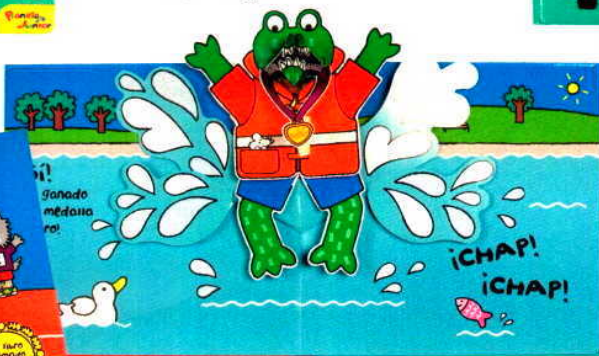
Los pop ups saltan y se mueven. El niño querrá cogérselos y, cuidado, ¡jarrancarlos! (Edelvives; 14,20 €).