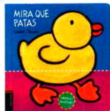
Hay que levantar y mover páginas para unir las patas con su dueño (Edelvives; 8,30 €).