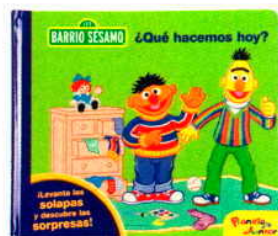
Los personajes de Barrio Sesamo descubren en cada página una gran sorpresa (Planeta Junior; 6,95 €).

Dónde se esconde el pollito? «¿Debajo de esta ventana?» dice mamá, y ayuda a su hijo a levantar la solapa. «Siiiiiii», gritan emocionados los dos. Los cuentos con ventanitas son los preferidos de los niños de esta edad, esconden secretos divertidísimos que, aunque se descubran mil veces, no dejan de ser emocionantes.