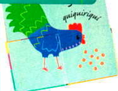
Con ventanitas gigantes, para los que se inician en esto de «leer» (Cometa; 9,50 €).